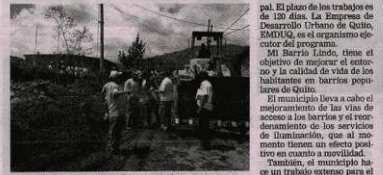
Infraestructura - Mejorar la calidad de vida de los habitantes.

INVERSIÓN 2 millones 632 mil 371 dólares para obras de infraestructura, equipamientos y servicios.