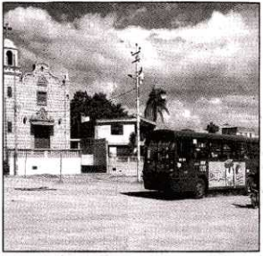
En esta polareda se construirá un parque.

La regeneración del parque central de San José Morán, al norte de Quito, beneficiará a tres barrios. Desde hace una semana, el Municipio, junto a moradores de San José,