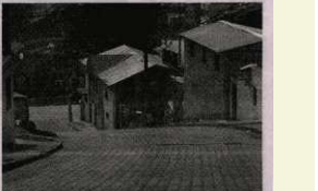
Mi Barrio Lindo - Hace barrios populares, ordenados y seguros.

El Municipio de Quito, a través de la Empresa de Desarrollo Urbano, ejecutará el Programa de Mejoramiento Integral de Barrios.