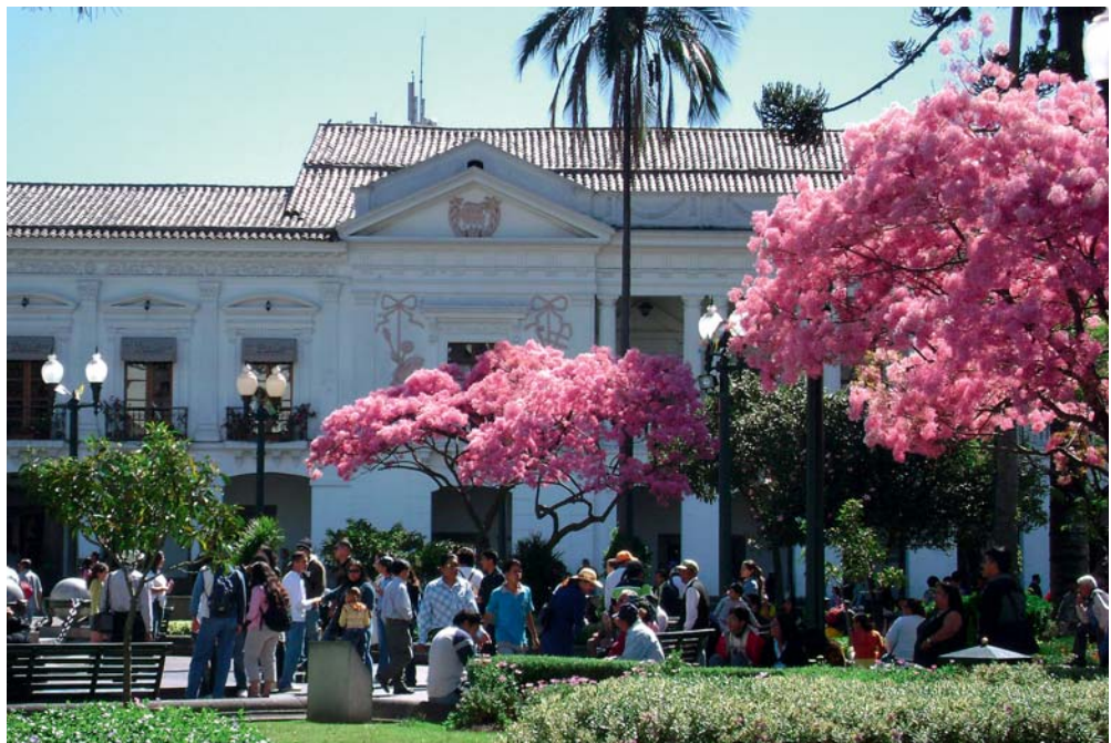
QUITO, ECUADOR.

Hoy, mil millones de personas viven en estos nuevos escenarios, en asentamientos caóticos y precarios, que ocupan dispersamente un territorio postmetropolitano, de los que ha desaparecido cualquier atisbo del acuerdo o comunidad anterior, sin ser sustituido por otra alternativa de convivencia. En medio de esta mutación sin precedente, la enorme inercia de la ciudad construida hace que subsista entre los ciudadanos la convicción de que esos cambios son de una trascendencia y alcance menor, sin advertir que de esa ciudad histórica tan sólo permanece como apariencia.