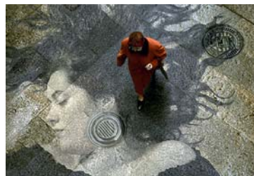
«LA MUJER CONSTRUYE». MADRID, ESPAÑA.