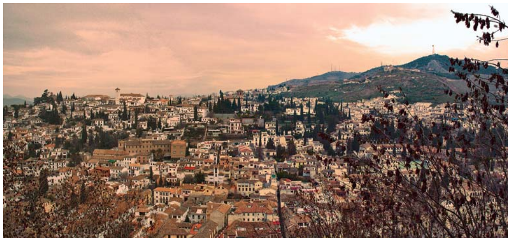
GRANADA, ESPAÑA.

Desde estos presupuestos y teniendo en cuenta los enfoques y conclusiones del Congreso «La ciudad viva», «La ciudad viva como Urbs» pretende reflexionar sobre los componentes y la naturaleza de la cultura material lo que son y serán los escenarios urbanos resultados de esta mutación. Proponiendo una funcionalidad alternativa para la misma, responsabilizándose de las diversas exigencias presentes en el nuevo contrato natural que conduce a otra convivencia, apostando por la necesidad de la participación ciudadana y dando marco a su viabilidad a través del proceso puesto en marcha por la Carta de Cádiz.