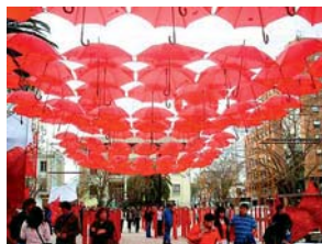
«MIL PLAZAS». TALCA, CHILE.