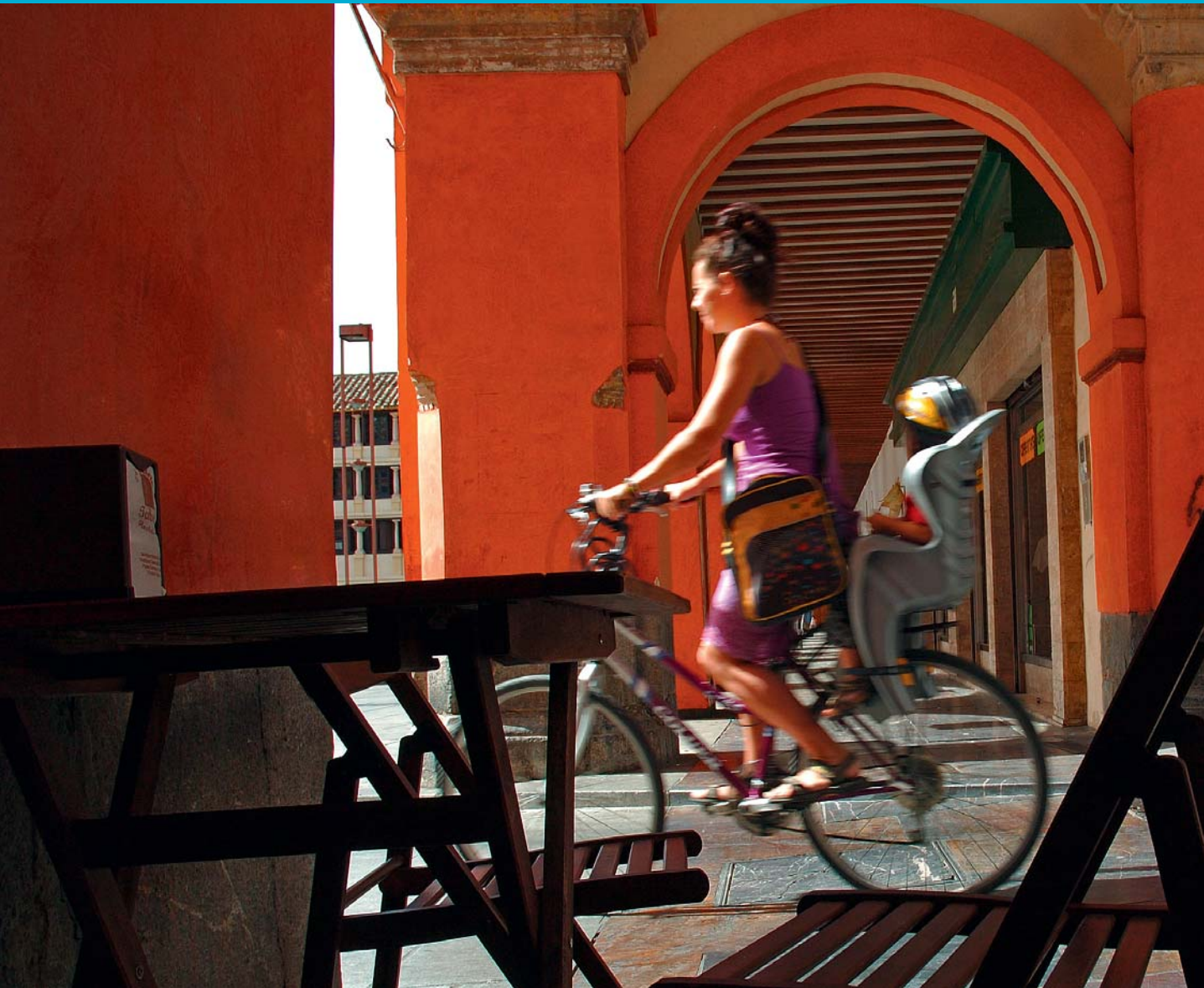
CÓRDOBA, ESPAÑA.