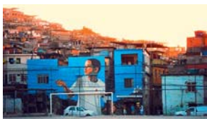
«FAVELA PAINTING». SAO PAULO, BRASIL.