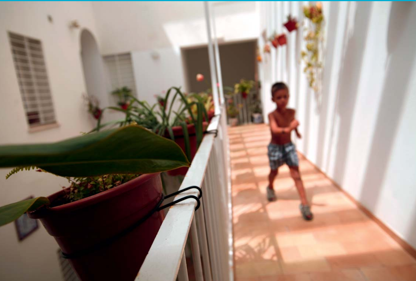
CÁDIZ, ESPAÑA.

La nueva geografía planetaria nos habla de que en 2050 esta cifra puede llegar a 3.500 millones y que el 95% del crecimiento de las ciudades se produce y se producirá en los países en vía de desarrollo, desplazándose así el centro de la mutación de los países occidentales a ámbitos apartados hasta ahora cultural y socialmente de una determinada urbanidad. Podemos concluir, que es en estas aglomeraciones, cuya caracterización desafía nuestro imaginario urbano, donde se va a librar la lucha decisiva contra la pobreza, la exclusión social, el cambio climático y la recuperación de procesos de desarrollo cualitativo compatibles con la conservación de los equilibrios básicos del planeta, tales como el mantenimiento de la biodiversidad y de los recursos básicos no renovables. Esos serán los escenarios donde emergerán los fermentos y las incitativas para un contrato natural, para una nueva alianza urbana.