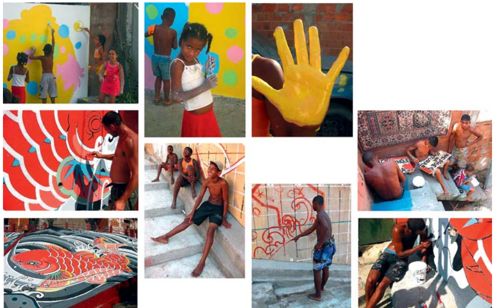
«FAVELA PAINTING». SAO PAULO, BRASIL.

http://www.laciudadviva.org/04_experiencias/