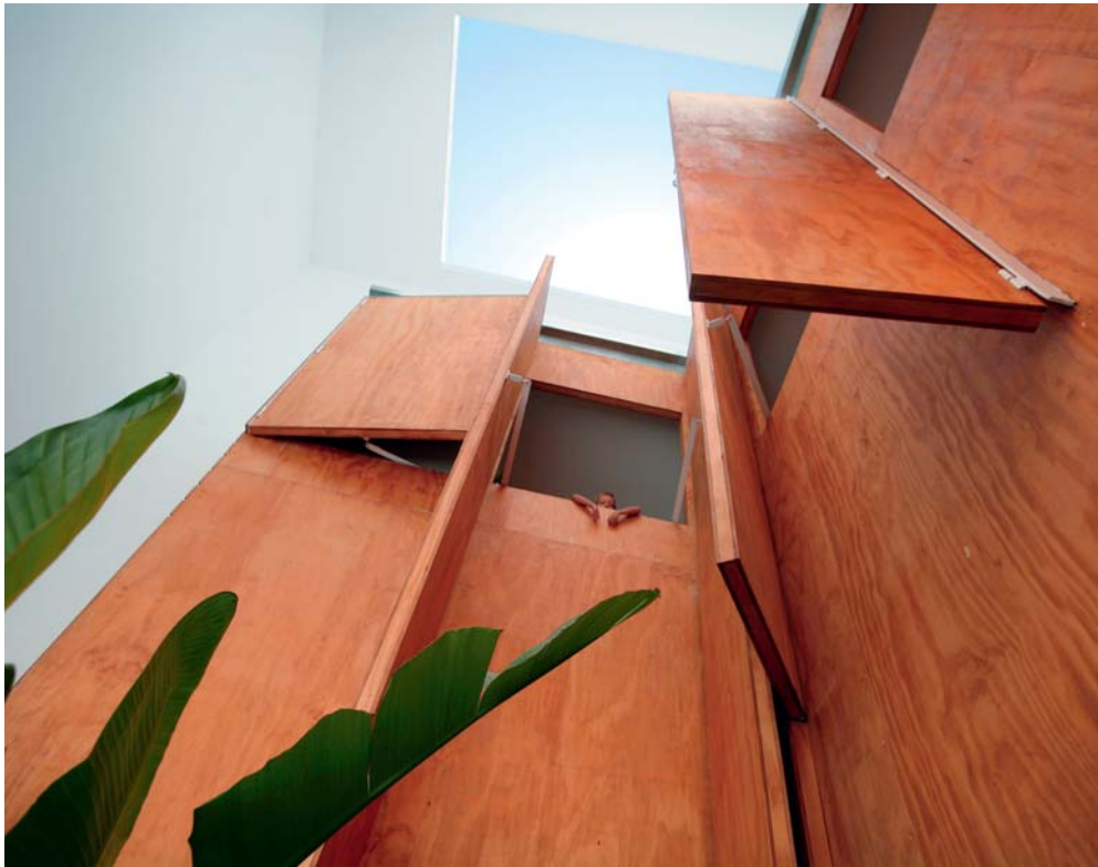
«REHABILITACIÓN DE VIVIENDAS». CÁDIZ, ESPAÑA.