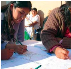
«CONJUNTO DE 93 VIVIENDAS». IQUIQUE, CHILE.