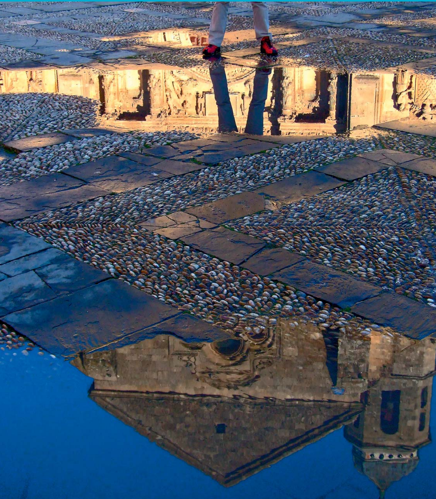
ÚBEDA, JAÉN, ESPAÑA.