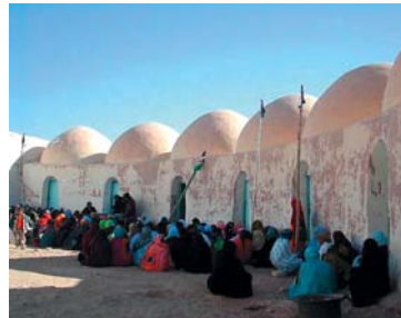
«CAMPAMENTOS DE REFUGIADOS SAHARAUIS DE TINDOUF». ARGELIA.