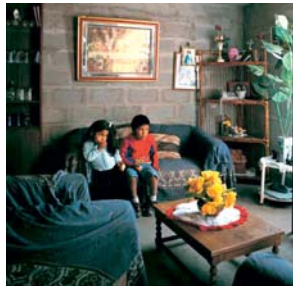
«CONJUNTO DE 93 VIVIENDAS». IQUIQUE, CHILE.