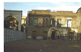
PLANOS DEL PROYECTO DE REMODELACIÓN. DERECHA: VISTAS DE LA FACHADA EXISTENTE E IMAGEN DEL INTERIOR DEL SOLAR. IZQUIERDA: ARCO DE ACCESO CENTRAL DE LA CRUJÍA ORIGINAL, ÚNICO ELEMENTO QUE PERMANECE EN PIE.