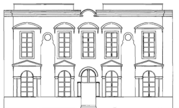
FACHADA C/ DIECIOCHO