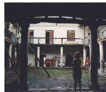
PLANOS DEL PROYECTO. FACHADA DURANTE LAS OBRAS DE RESTAURACIÓN. IZQUIERDA: CASA PONCE ANTES DE LA ACTUACIÓN. DERECHA: TRAMO DE LA CALLE ROCAFUERTE CON CASA PONCE Y PATIO INTERIOR DE LA CASA ANTES DEL COMIENZO DE LAS OBRAS.