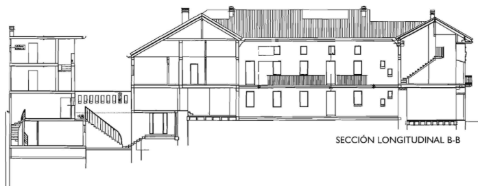
SECCIÓN LONGITUDINAL B-B