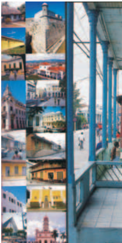
Imágenes de la guía del Oriente de Cuba Plano de recorridos patrimoniales. Guía de Valparaíso. Chile