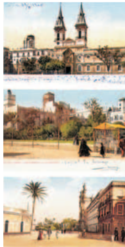
Imágenes históricas de Cádiz

Andalucía, todas, la presencia en el discurrir del morador y el visitante, localizar, identificar, ponderar y construir la referencia, la arquitectura como un bien, el producto histórico en icono-