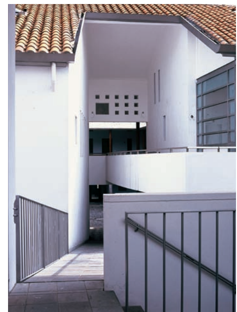
Guía de arquitectura de Chiloé Rehabilitación de la Casa de los Siete Patios en Quito. Ecuador