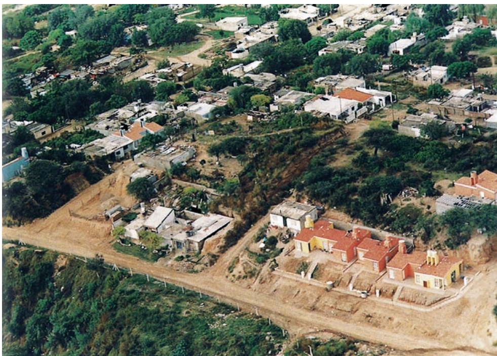
Pags. anteriores: proyecto de rehabilitación en el Centro Histórico de La Habana y vista aérea de La Habana Arriba: Los Ángeles en la región del Bio Bio y Villa Urquiza

habíamos realizado en Buenos Aires el primer Encuentro sobre Puertos y Fortificaciones en Iberoamérica, que luego habría de continuar con otros varios, incluyendo la Exposición "El sueño de un orden", que se presentó en muchos países de América.