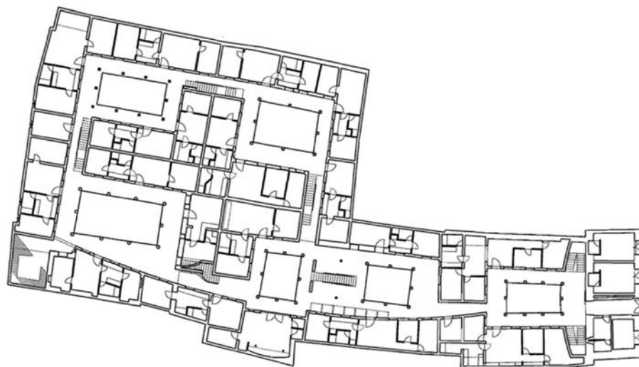
Plan de rehabilitación del barrio Sur de Montevideo. Uruguay