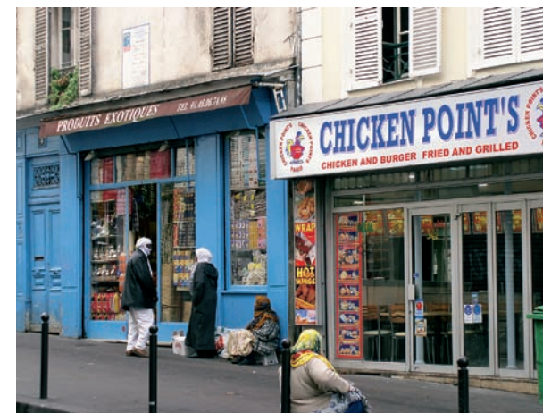
Pag. anterior: los "terrains vagues"