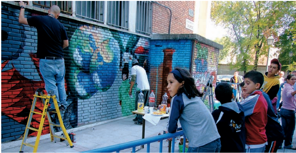
Pedagogía del hábitat. Mural: Un barrio, muchos mundos

Pag. siguiente: Mercadillo en Almanjáyar. Granada