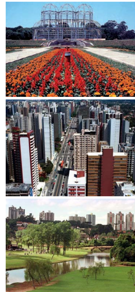
Imágenes de parques y avenidas de la ciudad de Curitiba Imágenes extraídas de la experiencia Curitiba

Gracias a estas innovaciones los tiempos de recorrido de los autobuses de Curitiba transportan a 20 mil pasajeros por hora (más de los que viajan sobre el transporte públicos de Nueva York). Los autobuses