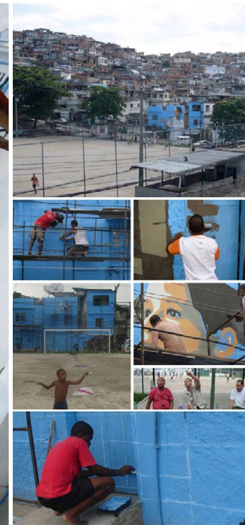
Imágenes de la participación de los vecinos en el proyecto. Imágenes extraídas de la experiencia Favela Painting