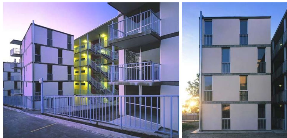
Imágenes del conjunto de viviendas de la Comunidad Andaluca Imágenes extraídas de la experiencia Programa de Cooperación en Chile

- Villa la Reina es una población de 1600 viviendas, realizadas por autoconstrucción en los años setenta. La villa se compone mayoritariamente de Pasajes que agrupan 20 ó 24 casas. Originalmente las viviendas no contemplaban antejardines y las casas daban a un espacio común de aproximadamente 8 m. de ancho. Cada casa cuenta además con un patio privado en la parte posterior. Con el tiempo, los vecinos fueron ocupando sus frentes y configurando antejardines cerrados con rejas, lo que significó reducir el espacio público a estrechos pasadizos de un metro, con el consiguiente problema de circulación