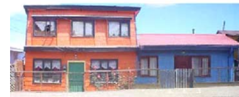
Imágenes de la rehabilitación de viviendas en Ancud, Chiloé Imágenes extraídas de la experiencia Programa de Cooperación en Chile