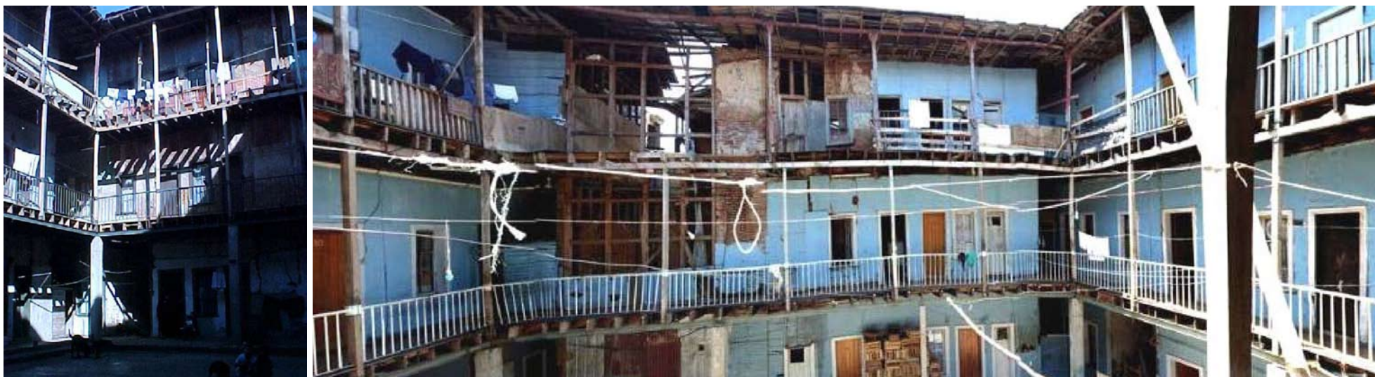
Plano de estructura de barrios del Plan regulador de Los Ángeles/ Imágenes de la rehabilitación integral del edificio de viviendas denominado Unión Obrera. Imágenes extraídas de la experiencia Programa de Cooperación en Chile