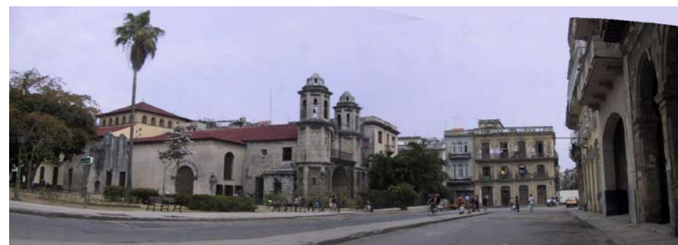
Plano e imágenes de La Habana. Imágenes extraídas de la experiencia extraídas de la experiencia de la Cooperación en Cuba