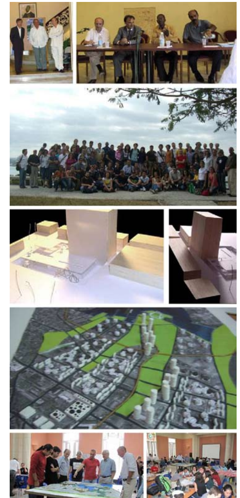
Infografías del concurso 3 esquinas de La Habana/ Imágenes de maquetas y participantes de los talleres realizados dentro del programa. Imágenes extraídas de la experiencia de la Cooperación en Cuba

Y si esto es reflejo del pasado, nuestros interlocutores no entienden un futuro sin la cooperación de la Consejería de Vivienda y Ordenación del Territorio, cuya presencia, constancia e implicación la hacen imprescindible en el escenario de la Cuba de los próximos años, un periodo que se presenta como apasionante por los cambios que necesariamente han de producirse, pero también por la necesidad de contar con amigos que, en palabras de Eusebio Leal "nunca ha(n) pretendido ofrecer soluciones a nuestros complejos problemas urbanos sin haber contribuido de antemano- a tratar de resolverlos eficazmente".