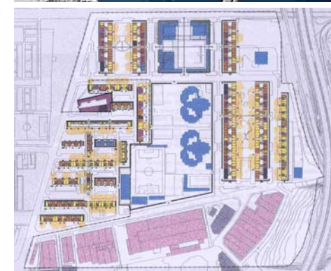
Plano e imagen aérea del barrio de la Mina, Barcelona.