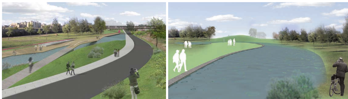
Infografías de la propuesta del parque Imágenes extraídas de la experiencia Parque sobre el antiguo cauce del río Guadaira

Con la exposición de la experiencia desarrollada en la ciudad de Sevilla, en el sector desestructurado urbana y socialmente de 'las Vegas' del Polígono Sur, se pretende mostrar la capacidad del proyecto contemporáneo para convocar –en situaciones complejas- intereses y lecturas diversas que inciden directamente en la vida de grupos poblacionales afectados y el conjunto de la ciudad. Estratégicamente se introducen procesos de espacialización de acuerdos provisionales entre los agentes implicados, sin olvidar cuestiones que atienden a la resignificación del paisaje urbano contemporáneo.