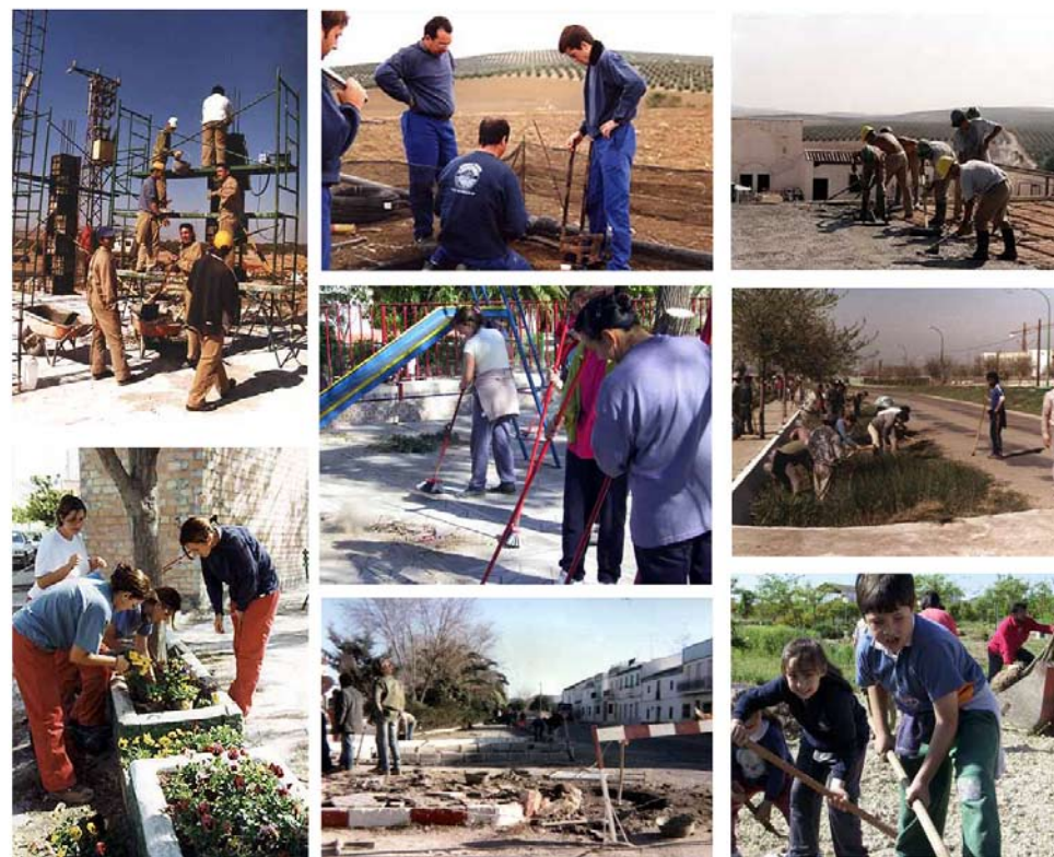
Imágenes de las viviendas y de algunos propietarios en el proceso de autoconstrucción Imágenes extraídas de la experiencia vivienda de autoconstrucción en Marinaleda