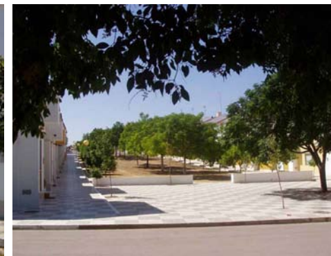
Imágenes de las viviendas. Imágenes extraídas de la experiencia vivienda de autoconstrucción en Marinaleda

Otro factor a tener en cuenta es el hecho de que los/as beneficiarios/as del programa de autoconstrucción trabajan en la ejecución de las obras juntos durante un par de años aproximadamente; esto en general supone una buena convivencia futura en el nuevo barrio ya que las personas que lo habitan se conocen, han compartido trabajo, tiempo, experiencias e ilusiones.