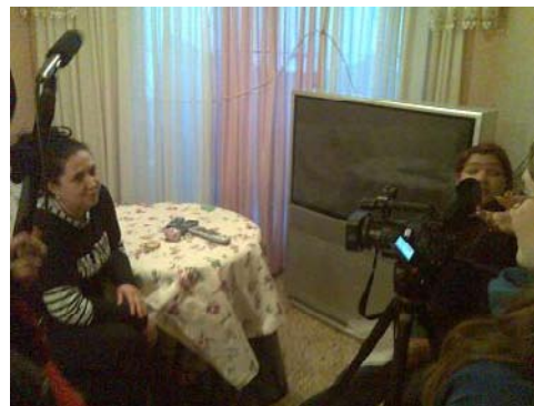
Las mujeres del Polígono Sur

La selección fue realizada en colaboración con el colectivo ZEMOS98, directores de las XI ediciones del Festival Internacio-