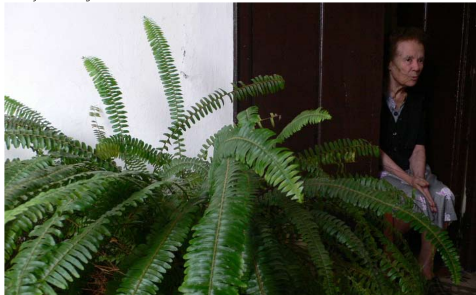
Caracoles, Bichos y Ladrillos

Imágenes extraídas de la presentación de videos urbanos en el congreso