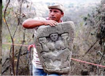
Cerro Jaboncillo: paisaje, yacimiento, estela encontrada en el sitio