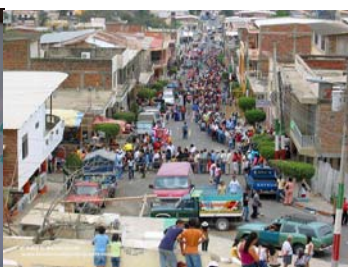
Montecristi: Pueblo y Museo