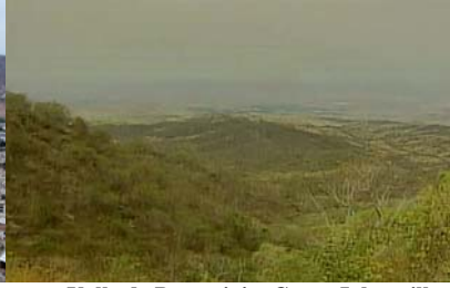
Valle de Portoviejo, Cerro Jaboncillo