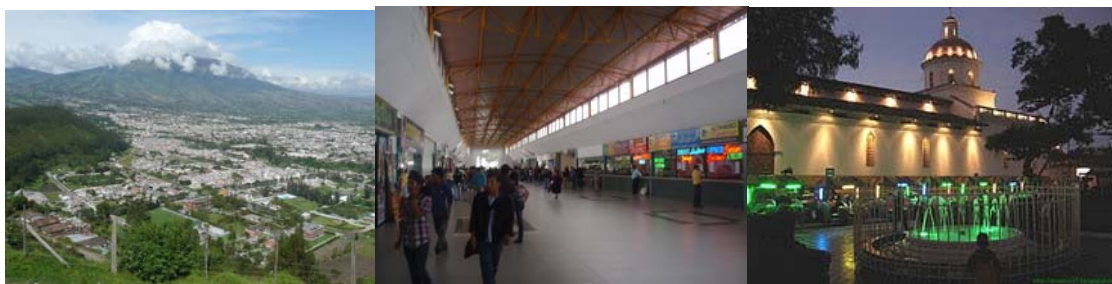
Ibarra, panorámica y terminal de autobuses

De todas maneras, existe diferencia en las formas de ver el mundo. Desde Europa, por ejemplo, parece que se lo viese desde más alto, con más posibilidades y mayor perspectiva. Desde España Afganistán existe, desde Ecuador pareciera que no, quizá debido a sus medios de comunicación y aunque existe parece interesar a poquísimas personas.